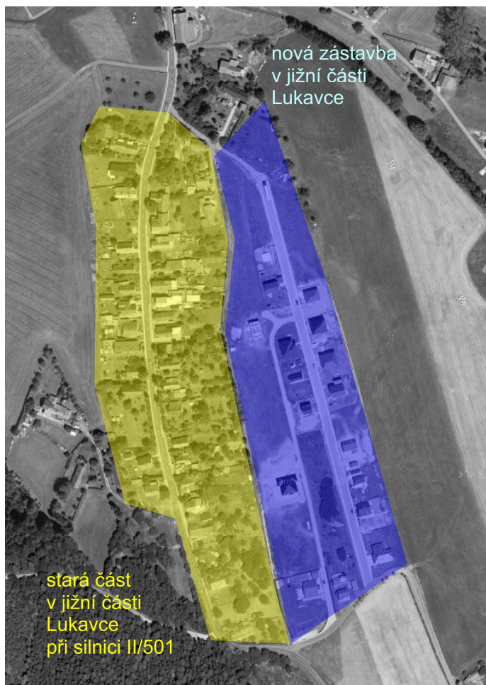
Schéma s vyznačením vybraných částí obce:

Místní část Lukavec (kompaktní části obce):