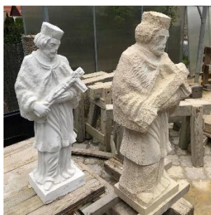
Rozpracované dílo sochy sv. J. Nepomuckého Zdroj: Ak. Soch. Michal Moravec

Zastupitelstvo obce na svém zasedání dne 29.12.2019 rozhodlo o obnovení této sochy